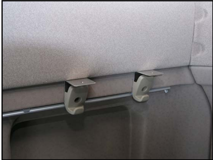
Abb. Fahrtrichtung rechts

Legen Sie die Bodenplatte mit dem Aluminiumwinkel nach vorne zeigend auf die so entstandene Auflage.