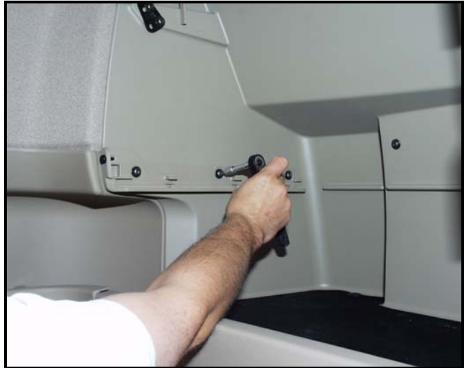
Abb. Fahrtrichtung links

Demontieren Sie die original Staufachklappen. Abb. Fahrtrichtung links