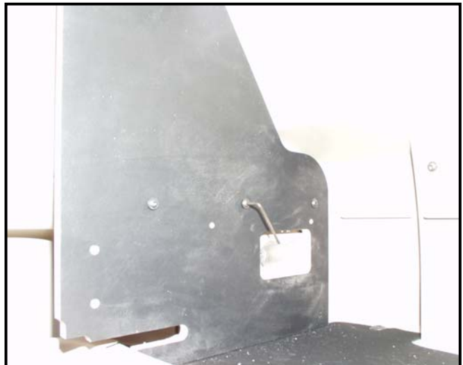
Abb. Fahrtrichtung links

Stellen Sie die Mitteltrennwände auf den Boden und verschrauben diese von unten durch die original Löcher mittels jeweils 2 Flachkopfschrauben M6x60. Siehe nächstes Bild